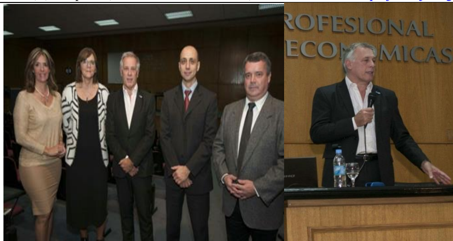
Foto: taller de capacitación

Paula A. de Sarmiento 134 (N) - Capital- (Casa de Gobierno - Pab. 4) Tel 0264-4296076 copesj@sanjuan.gov.ar