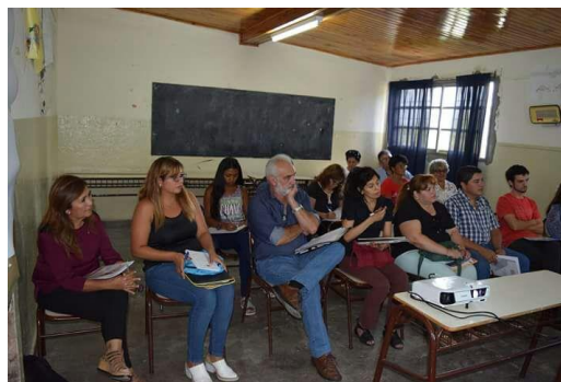
Departamento Valle Fértil