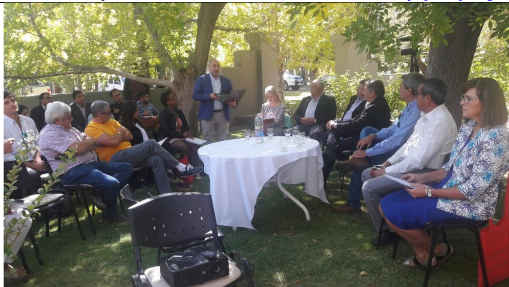
Interdepartamental: Taller de trabajo con los cuatro jefes comunales de los cuatro municipios

Paula A. de Sarmiento 134 (N) - Capital- (Casa de Gobierno - Pab. 4) Tel 0264-4296076 copesj@sanjuan.gov.ar